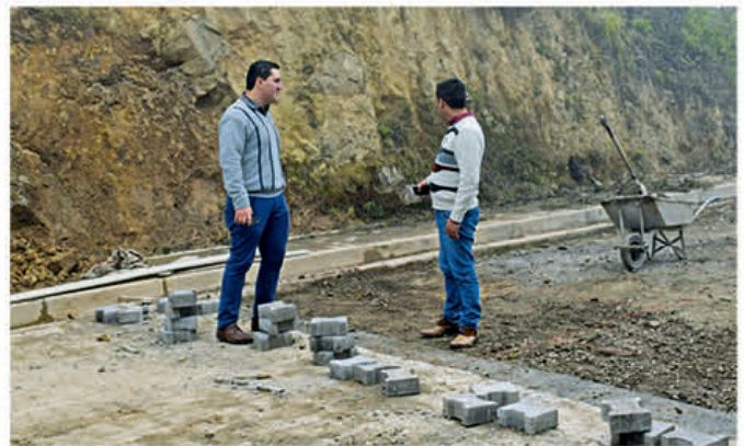
Inspección de obras en la parroquia San Rafael de Sharug