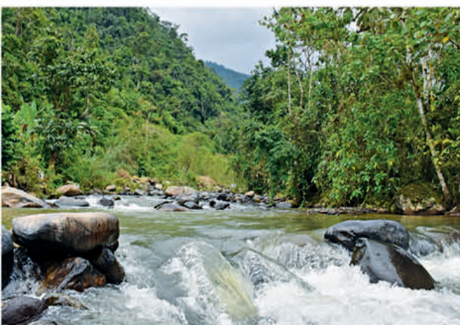
Río Vivar, uno de los atractivos en la zona baja del cantón

cafeterías, bares, tiendas, compañías de transporte y fomentar emprendimientos en diversas áreas y lugares del cantón.