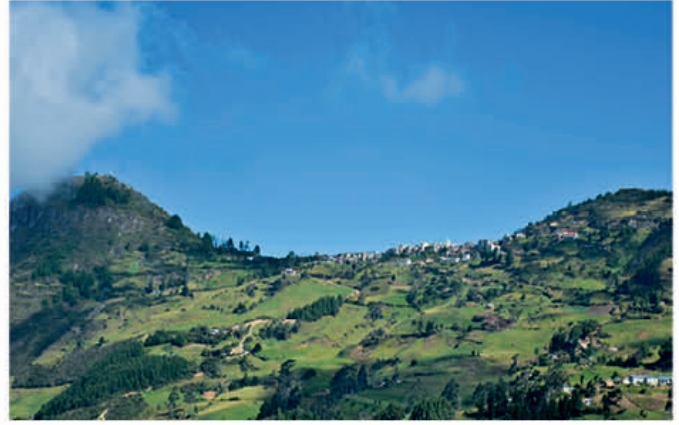
Una mirada general del cantón Pucará en medio de los dos hermosos cerros que lo cobijan

Este propósito pretende beneficiar a los propietarios de hoteles, restaurantes,