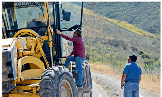
Mantenimiento vial en la zona media del cantón