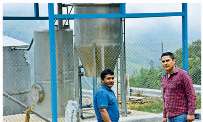
Fiscalización del Sistema Compacto de Agua Potable en Santa Marta