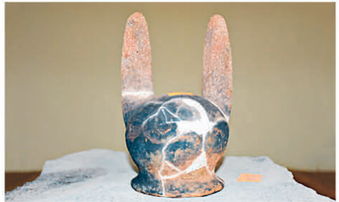
Un recipiente con una figura de un animal propio de la región. Se asemeja a una cabeza de un conejillo.