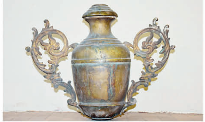
Piezas en fundido de cobre que utilizaban los primeros pobladores en el cantón.

De igual manera dicha publicación refiere a su ubicación geográfica del centro cantonal al estar en medio de dos cerros: Barishigua y Zhalo, considerándolo una pirámide cuadrangular trucada, donde existen restos de una construcción que debía tener una función militar y podría tratarse de un centro ceremonial al estar formado de una gran cantidad de terrazas que sirven para la agricultura, técnica utilizada por los Incas.