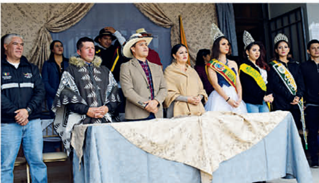
Autoridades cantonales durante la inauguración de las festividades de cantonización. Pregón de fiestas.