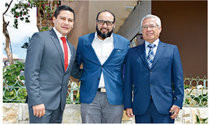
Xavier Martínez, gobernador del Azuay (E) se reúne con el alcalde de Pucará para celebrar las fiestas de cantonización de Nabón.