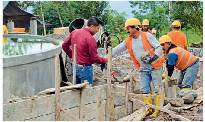
Fiscalización del Sistema de Agua Potable en la comunidad de Gramalote.

En cuanto a servicio de alcantarillado sanitario se trabaja en la red de alcantarillado en el centro de acopio, condominio del barrio San Francisco, Tipoloma y un tramo de la calle Daniel Brito, con un avance del 80% y un costo de 22.193.35 dólares.