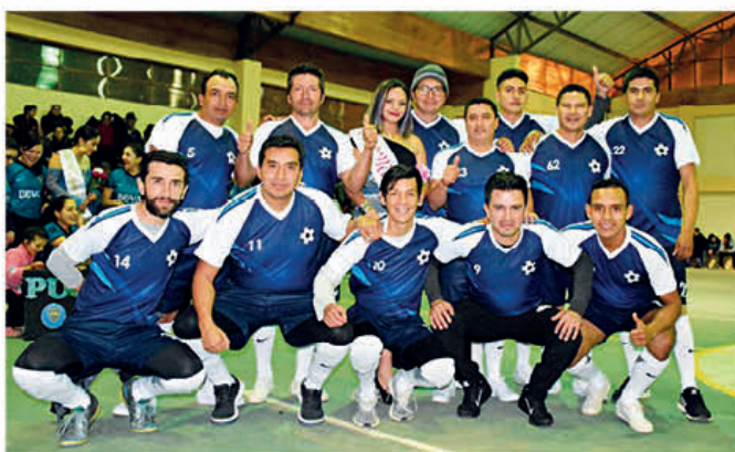
Inauguración del campeonato interinstitucional por las fiestas julianas. Equipo "Los Concejales"