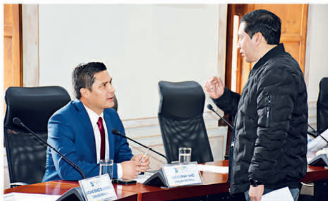
El alcalde Luis Yáñez participa de la conformación de comisiones en la Cámara de la Prefectura del Azuay con los demás concejeros.