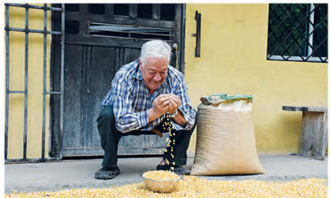
Pobladores de la zona media seca el maíz para guardar y luego utilizar.