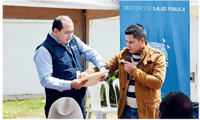
El MSP entrega equipos de laboratorio a Pucará y el GADM Pucará estudios arquitectónicos e informes técnicos