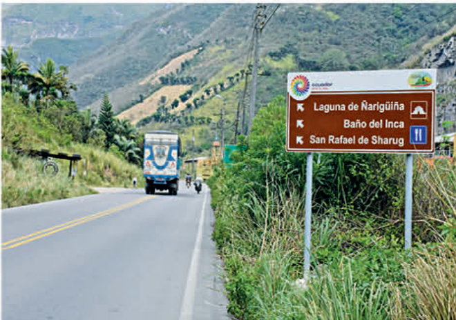
Señalización de los lugares turísticos en diferentes lugares del cantón Pucará