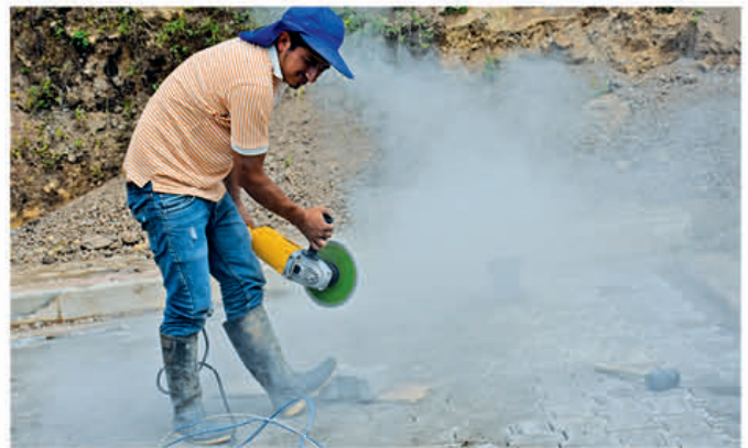
Personal del GAD Municipal trabaja en la regeneración urbana de San Rafael de Sharug