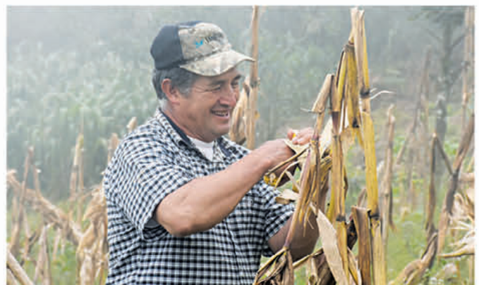
Agricultor cosecha las mazorcas en su pequeña chacra de maíz.