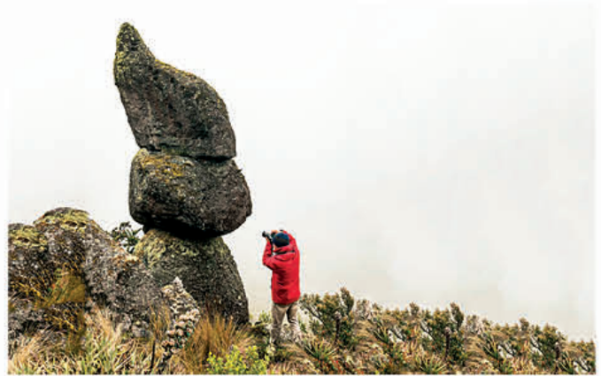
Las piedras con una figura espectacular, son propias de la zona alta del cantón.