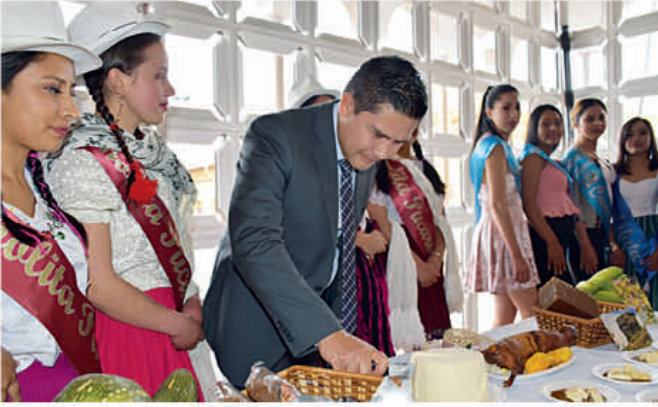
Candidatas a cholitas junto con el alcalde Luis Yáñez exponen la diversidad gastronómica que ofrece el cantón.