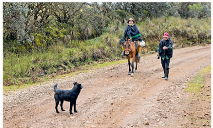
Comuneros que se benefician de los sistemas de Agua Potable.