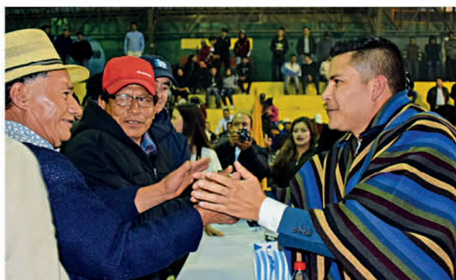
Felicitaciones por parte de la ciudadanía