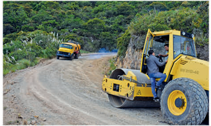
Equipo caminero del GAD Municipal Pucará trabajan en mantenimiento vial de la vía Tendales - San Rafael - Pucará

En la casa comunal de Tres Banderas se realizará adaptaciones en la cubierta y ventanas, mientras que en el camal del centro cantonal adecuaciones internas y externas.