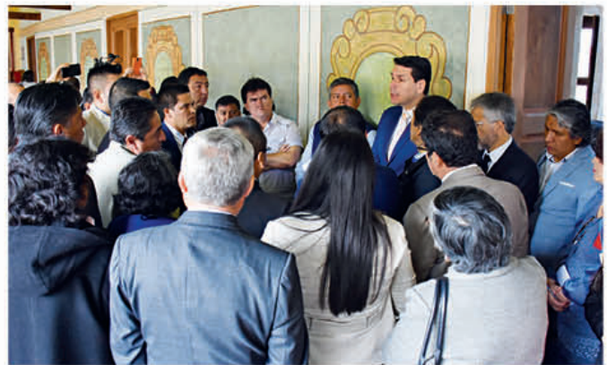
Conversatorio con los alcaldes del Azuay para creación de comisiones provinciales.