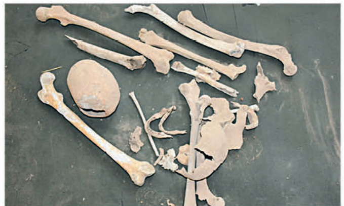
Restos de osamentas de un antepasado, estos huesos se encontraron junto a vasijas de barro.