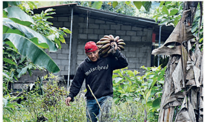
Campeño saca la fruta para comercializarlo a los visitantes