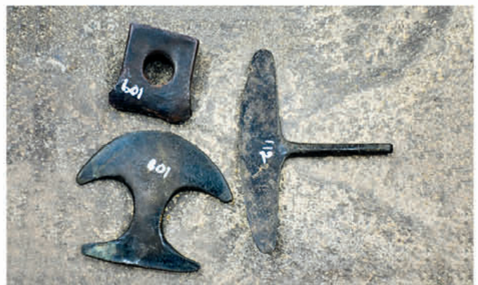
Herramientas en fundido de acero que utilizaban nuestros antepasados.