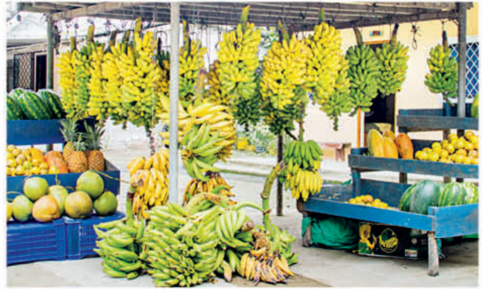
Frutas que comercializan pobladores de las comunidades de la zona baja.

En cuanto a bebidas; el aguardiente es tradicionalmente consumido por nuestros abuelos, abuelas y que hoy se mantiene como costumbre de los pucareños, con la frase particular "para el frío, hay que pegarse un buen trago", al reunirse entre vecinos, amigos, familiares o en una ocasión especial.