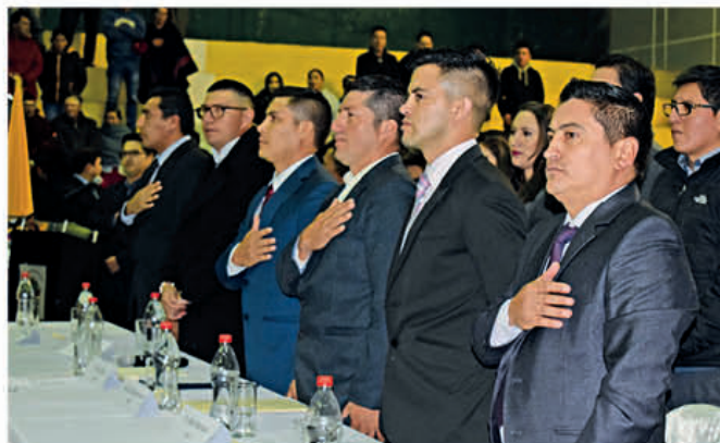
Ilustre Concejo del cantón Pucará

Con la entrega de placas, presentes, baile y más finalizó este acto solemne en el cantón Pucará.