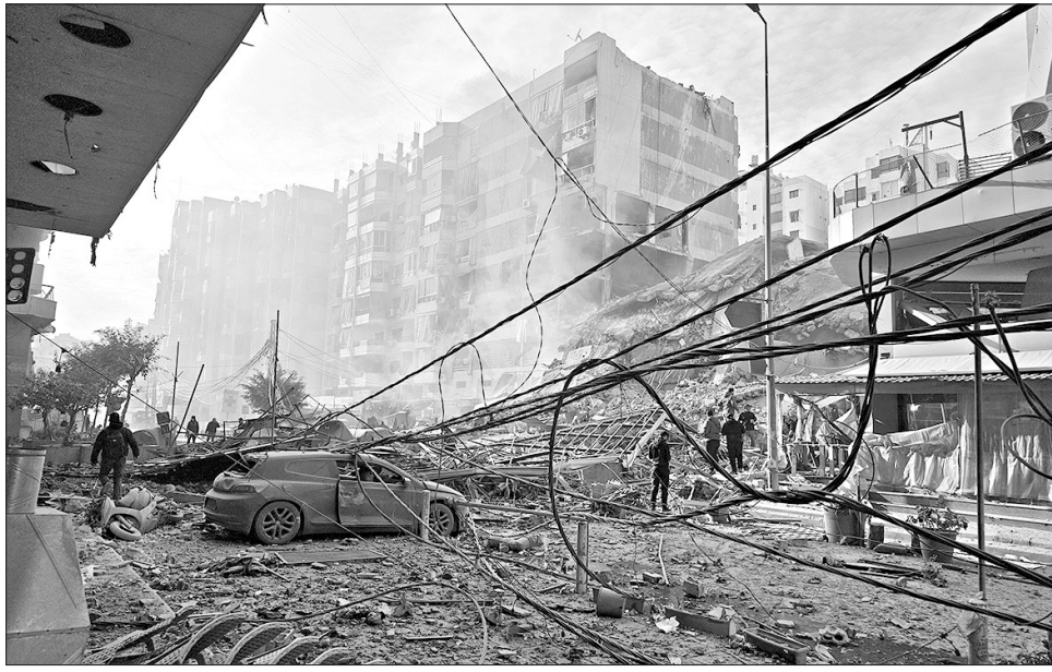
La ONU pide total transparencia en la investigación al bombardeo de una escuela en Minab, en Irán.

Las imágenes filmadas desde un estaciona-