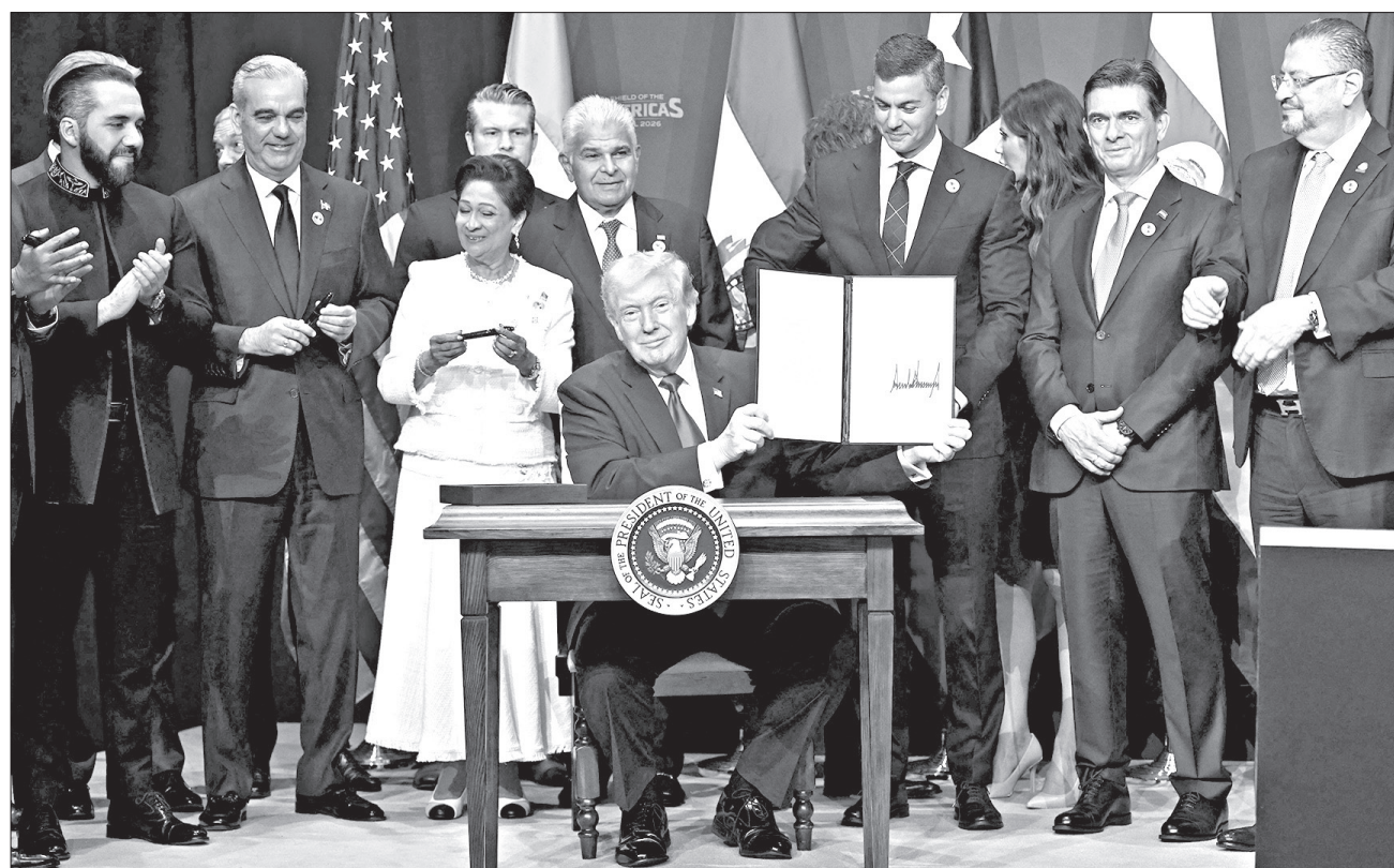
El presidente de Estados Unidos, Donald Trump, sostiene una proclamación recién firmada en la Cumbre "Escudo de las Américas" en Trump National Doral en Miami, Florida.

"Los líderes de esta región han permitido que grandes franjas de territorio en el hemisferio occidental queden bajo el control de pandillas transnacionales (...) No vamos a permitir que eso ocurra. Vamos a ayudar",