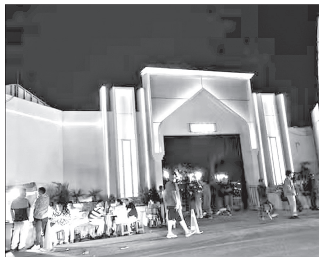
Una explosión se registró esta madrugada dentro de la discoteca Dalí, en La Libertad, en Trujillo. / x

"Tenemos 33 heridos ya reportados hasta la ac-