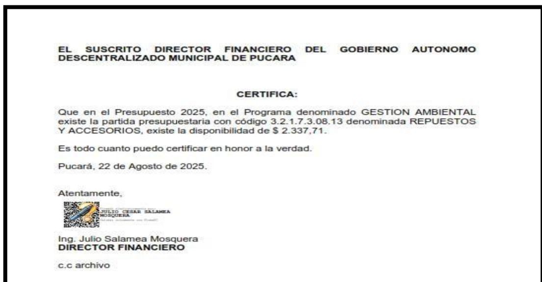
Imagen Nro. 4

La Dirección Financiera ha emitido la correspondiente Certificación Presupuestaria, la cual garantiza la disponibilidad de recursos económicos suficientes dentro de la misma partida presupuestaria ya asignada, por lo que se ratifica la viabilidad financiera de esta modificación.